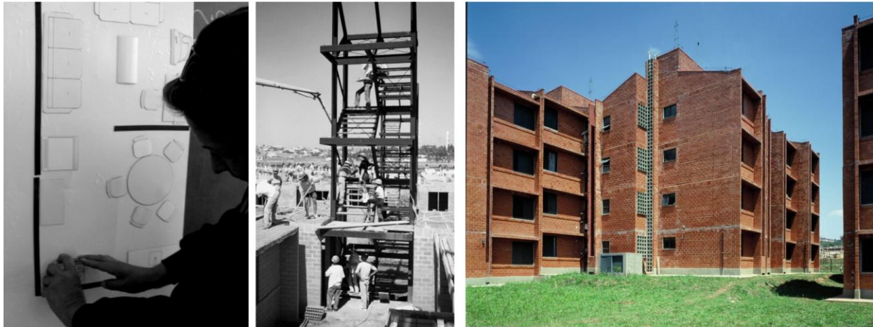
Figura 2 - População tem a oportunidade de mudar e refazer o projeto | Inovação tecnológica: as escadas metálicas são colocadas na mesma etapa que são feitas as fundações | Vista geral do conjunto

Os edifícios foram fechados com blocos estruturais cerâmicos aparentes, que dispensaram o uso de vigas e pilares e sua consequente execução complexa e dispendiosa de fôrmas e armaduras. Com isso, a obra foi radicalmente simplificada e racionalizada, evitando os serviços mais difíceis e que colocavam em risco os trabalhadores.