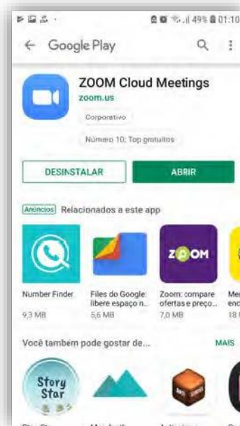
Figura 2- Instalação Loja