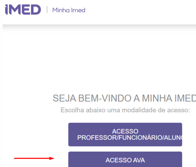
Figura 2 – Acesso AVA