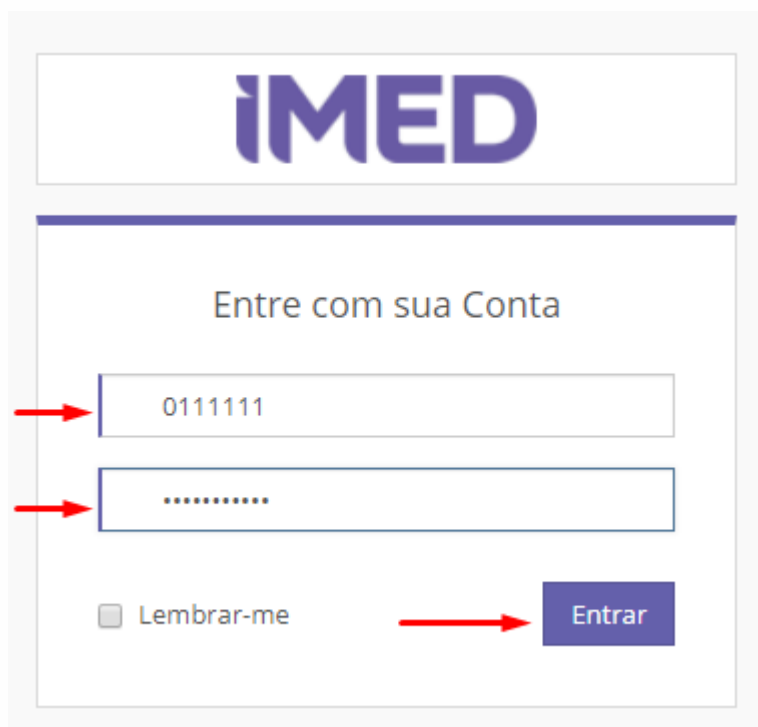
Figura 3 – Login e Senha

O usuário é o número de matrícula (RA – Registro Acadêmico).