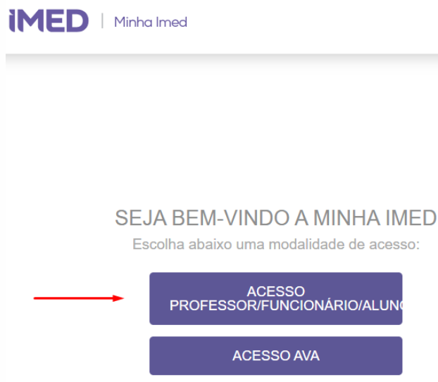
Figura 2 – Acesso aluno

1.2 Clicar em acesso como Professor/Funcionário/Aluno