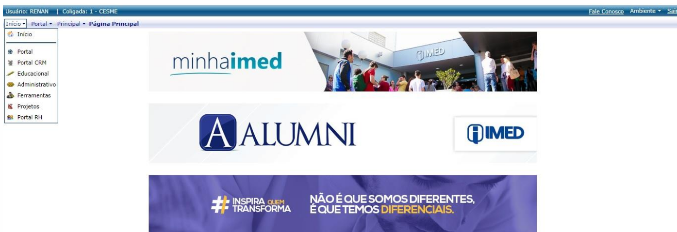
Figura 4 – Acesso Portal Minha IMED

1.4 Após inserir os dados corretos para acesso, estará logado no Portal Minha IMED.